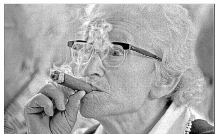
Kein Bild aus Kuba: Diese Aufnahme entstand 1982 in Diez. „Unter Dampf“ haben die Fotografen es genannt.